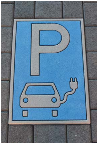
Parkplatz Elektro KfZ 40x60cm