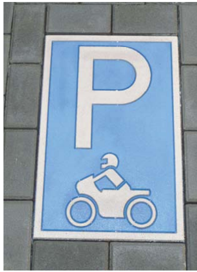
Parkplatz Motorradfahrer 40x60cm