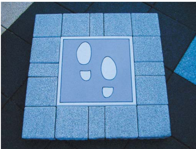
Gehende Füße 50x50cm