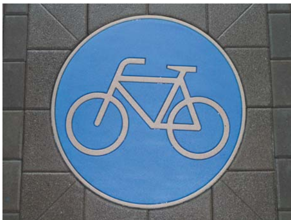
Fahrradweg 78cm mit Anschlusssteinen 100x100cm