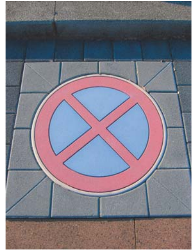
Halteverbot 78cm mit Anschlusssteinen 100x100cm