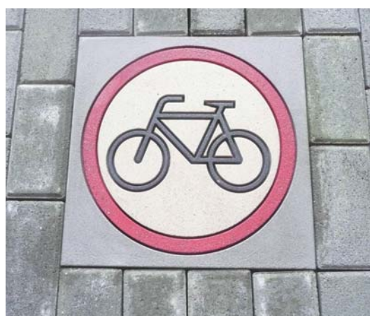
Verbot für Radfahrer 40x40cm