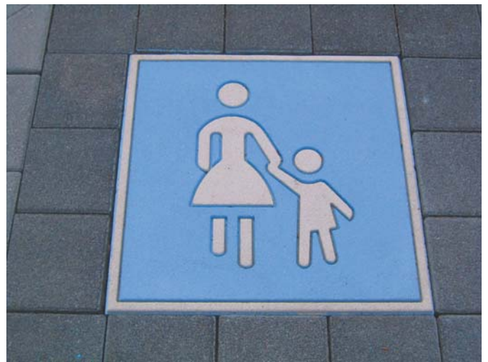
Sonderweg Fußgänger Mutter & Kind Parkplatz 60x60cm