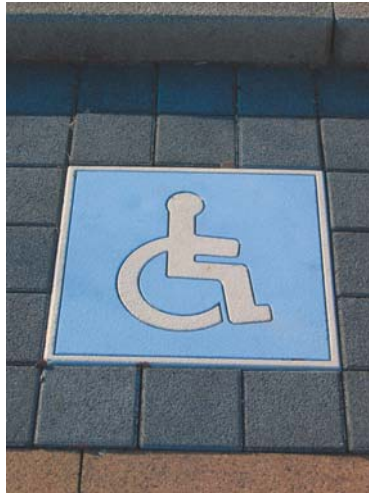
Parkplatz Rollstuhl 60x60cm